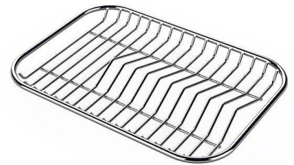
Tellerständer aus Edelstahl 8100 154